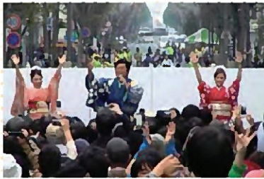
PV 「船平健 船平健 船平健」 ※ときわ通り~花園商店街