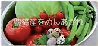
豊橋産をのしあがり