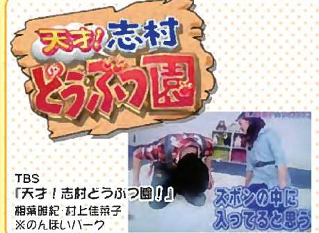
TBS 「天才! 志村どうぶつ園!」 相葉雅紀・村上佳菜子 ※のんほいパーク